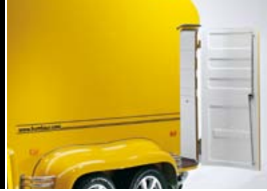
Seitliche Türe mit 3-Punkt-Verriegelung, abschließbar