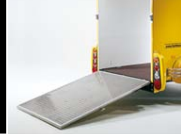
Überfahrwand mit 2 Gasfedern und Aluriffelblech belegt