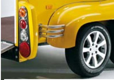
Alufelgen, Design-Heckleuchten, Chrom-Zierbügel